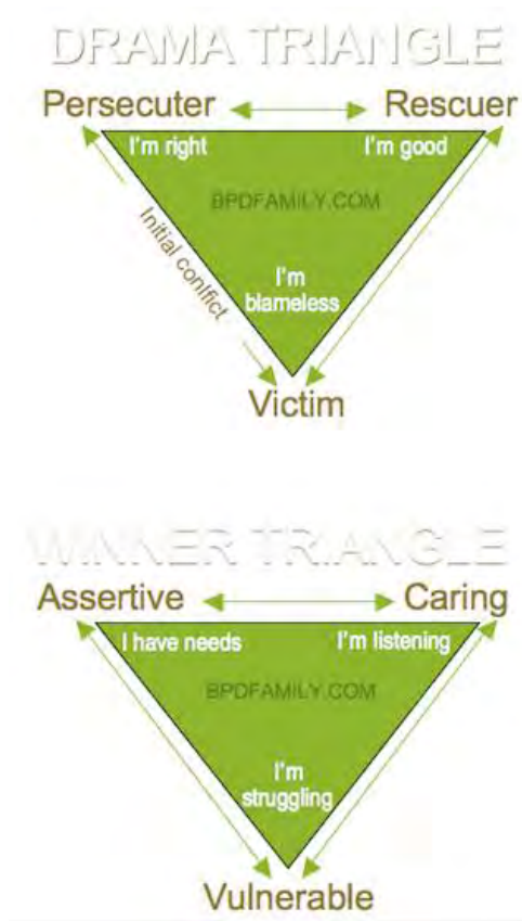
Γράφημα του Τριγώνου του Νικητή (Choy)

Το δεύτερο θεραπευτικό μοντέλο είναι το Τρίγωνο Ενδυνάμωσης , που προτάθηκε από τον D. Emerald. Η Δύναμη της Δυναμικής της Ενδυνάμωσης συνιστά στο "θύμα" να υιοθετήσει τον εναλλακτικό ρόλο του δημιουργού, να δει τον διώκτη ως διεκδικητή και να επιστρατεύσει έναν προπονητή αντί για έναν διασώστη 21 .