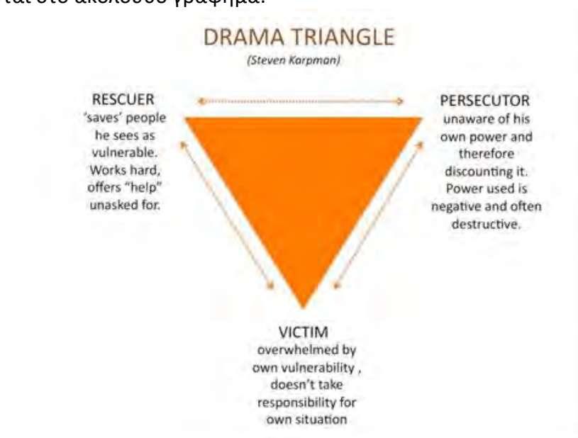
Γράφημα του Δραματικού Τριγώνου (Karpman)

έναν τύπο καταστροφικής αλληλεπίδρασης που μπορεί να συμβεί μεταξύ ανθρώπων που βρίσκονται σε σύγκρουση. Το μοντέλο του δραματικού τριγώνου είναι ένα εργαλείο που χρησιμοποιείται στην ψυχοθεραπεία, συγκεκριμένα στη συναλλακτική ανάλυση. Το τρίγωνο των δρώντων στο δράμα είναι οι διώκτες, τα θύματα και οι διασώστες. Ο Karpman χρησιμοποίησε τα τρίγωνα για να χαρτογραφήσει συγκρουσιακές ή δραματικά έντονες συναλλαγές σχέσεων 16 . Το τρίγωνο του δράματος Karpman μοντελοποιεί τη σύνδεση μεταξύ της προσωπικής ευθύνης και της εξουσίας στις συγκρούσεις και τους καταστροφικούς και μεταβαλλόμενους ρόλους που παίζουν οι άνθρωποι 17 . Όρισε τρεις ρόλους στη σύγκρουση: διώκτης, διασώστης (οι θέσεις ένα πάνω) και θύμα (μια κάτω θέση). Ο Karpman τοποθέτησε αυτούς τους τρεις ρόλους σε ένα ανεστραμμένο τρίγωνο και αναφέρθηκε σε αυτούς ως τις τρεις όψεις ή πρόσωπα του δράματος, όπως παρουσιάζονται στο ακόλουθο γράφημα: